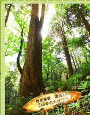
樹齢 500 年の大サワラ 直径 2.5m (胸高周囲 6.7m) の大サワラは圧巻です。