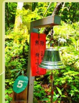
コース内 12 か所に設置されているクマよけの鐘