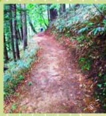
軌道敷跡 かつては、伐採した木材を運搬していました。(広くて歩きやすい)

木曾川の源流のひとつでもある水木沢には、樹齢 200 年を超える天然林が広がっており、美しい水が一年中絶えることなく流れ出しています。